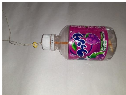
⑥ はりがねにワッシャを通す