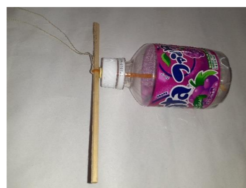
⑦ ワッシャの上に割りばしを通す