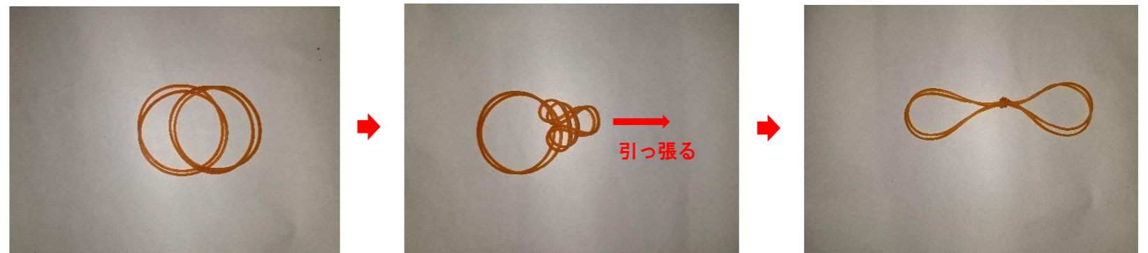
② 輪ゴムを連結する