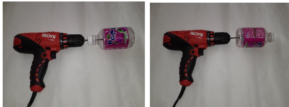
① ドリルで穴をあける