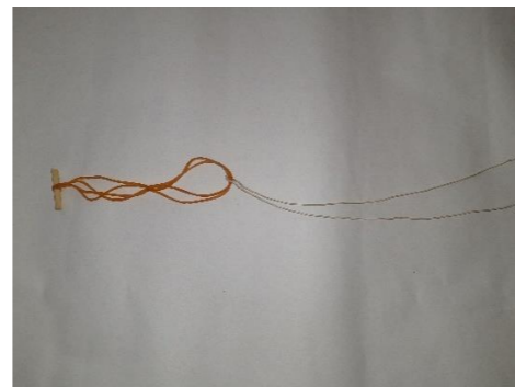
④ 輪ゴムにはりがねを通す